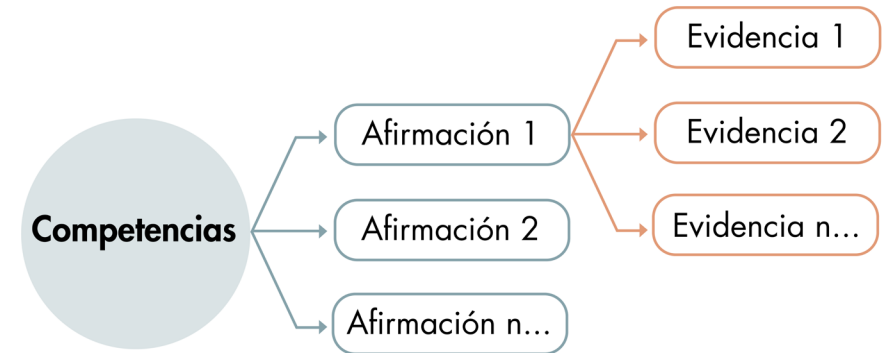
Figura 1. Diseño Centrado en Evidencias

Para consultar la metodología usada en la construcción de los módulos y pruebas de los exámenes Saber, le invitamos a consultar la página web del Icfes.